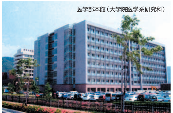
医学部本館(大学院医学系研究科)