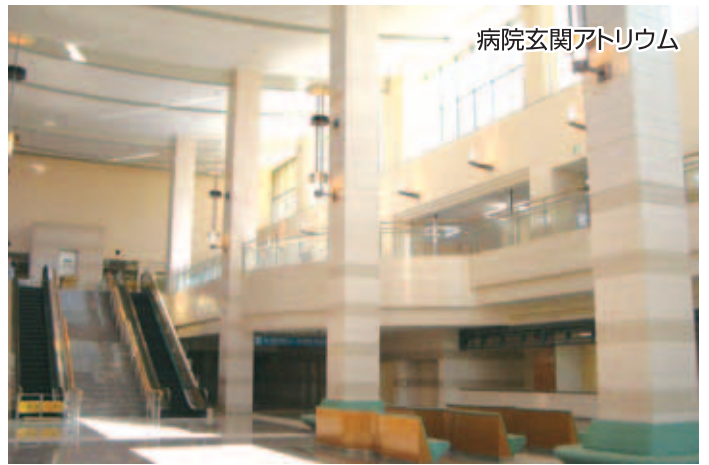
病院玄関アトリウム