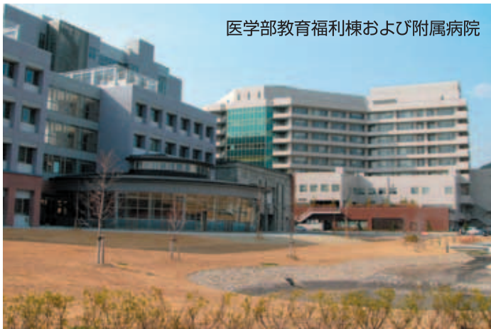
医学部教育福利棟および附属病院