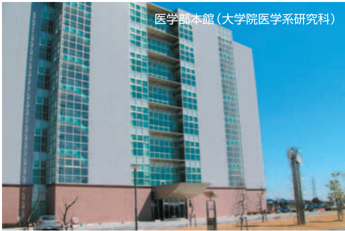
医学部本館(大学院医学系研究科)