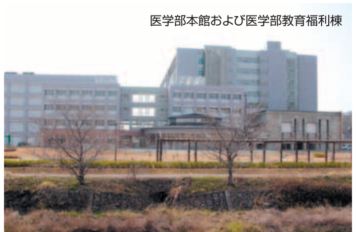
医学部本館および医学部教育福利棟