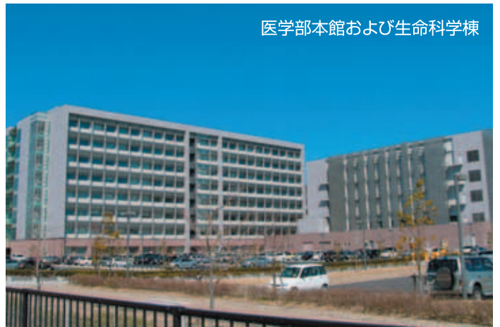
医学部本館および生命科学棟