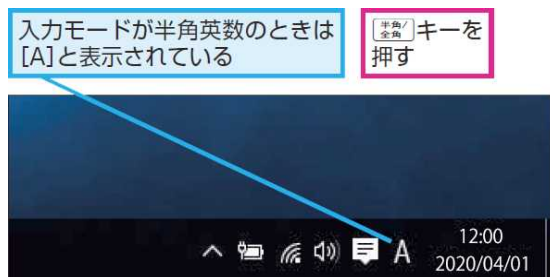
(画面右下の切り取り画像)