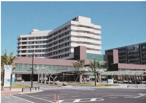
岐阜大学医学部附属病院

岐阜大学医学部附属病院(写真)をはじめとする県内の病院や老人保健施設、市町村保健センター、県保健所、企業などで、実習を行います。